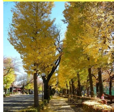
さくら通りの紅葉／国立市