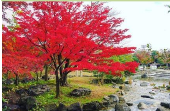
府中市郷土の森博物館の紅葉／府中市