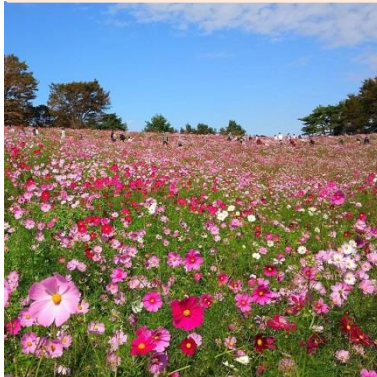
国営昭和記念公園の コスモス／立川市