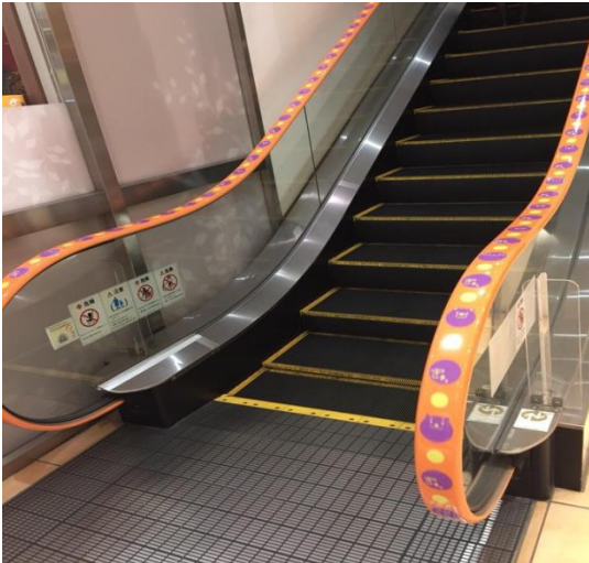
2017年に「アトレ目黒」に施工されたエスカレーター