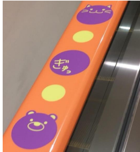
手すりデザインアップ図

文京学院大学では、「自立と共生」の理念を基に、実践力が身につく多彩な教育機会をこれからも学生たちに提供してまいります。