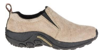
ジャングル モック

MERRELL YouTube チャンネル： https://www.youtube.com/channel/UC13E10yckCdRU8vCAhe1I-Q