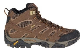
モアブ 2 ミッド ゴアテックス