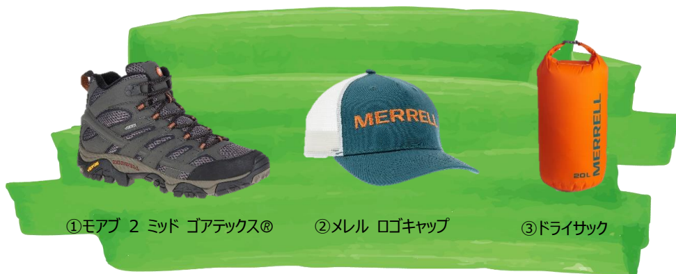
①モアブ 2 ミッド ゴアテックス®