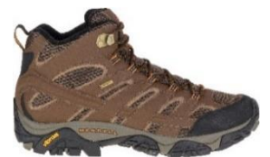
モアブ 2 ミッド ゴアテックス