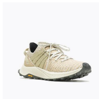
[WOMENS - LICHEN]