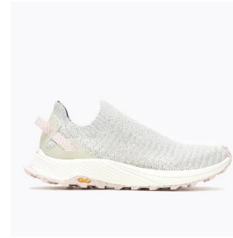
[WOMENS – ROSE]