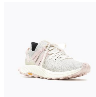
[WOMENS - LICHEN]