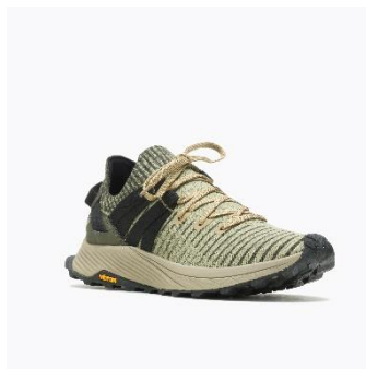
[MENS - OLIVE]