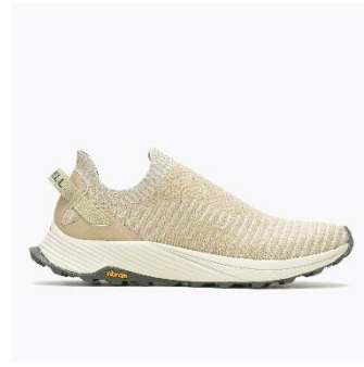
[WOMENS – OYSTER]