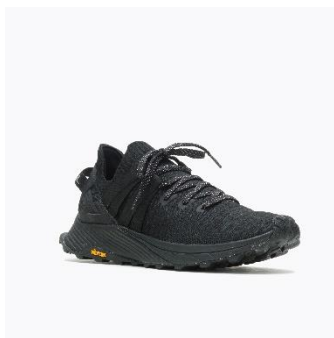
[MENS - BLACK]