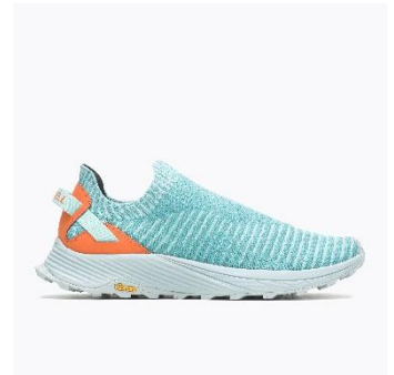
[MENS – MINERAL]