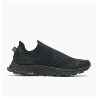
[MENS – BLACK]