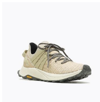
[MENS - OYSTER]