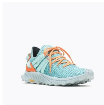
[MENS - MINERAL]