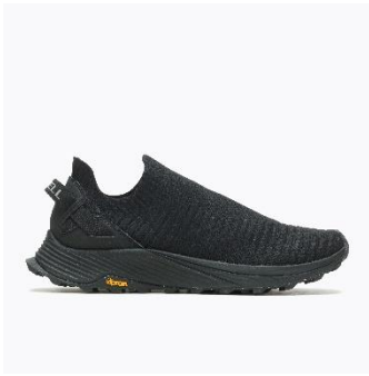
[WOMENS – BLACK]