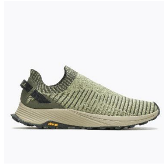
[MENS – OLIVE]