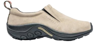
ジャングル モック

MERRELL YouTube チャンネル： https://www.youtube.com/channel/UC13E10yckCdRU8vCAhe1I-Q