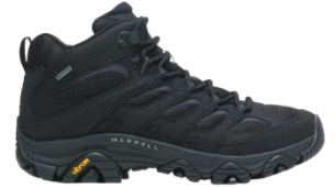
モアブ 3 シンセティック ミッド ゴアテックス