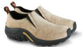
ジャングル モック

MERRELL HISTORY : http://www.merrell.jp/about/index.html