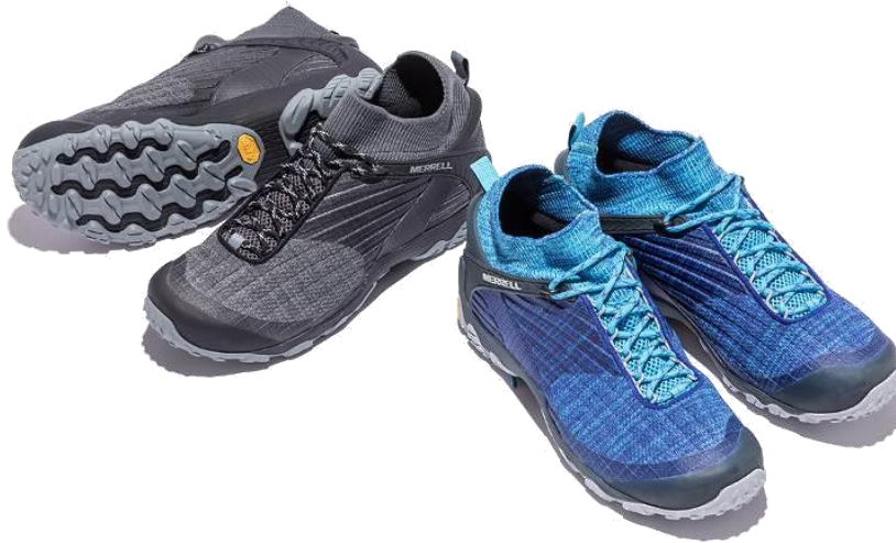
CHAMELEON 7 KNIT MID

世界 160 カ国で愛用される米国アウトドアブランド MERRELL（メレル、輸入総代理店：株式会社丸紅フットウェア）は、多彩なカラーバリエーションとスタイリッシュなデザインが人気のカメレオンシリーズにニットアッパーを採用し、アップデートしたモデル「CHAMELEON 7 KNIT MID（カメレオン 7 ニット ミッド）」を発売します。