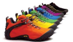
カメレオン 2 ストーム 日本限定色第二弾（2009）

新作シューズである「CHAMELEON 7 STORM GORE-TEX®」は、そのユースフルなデザインは勿論、カメレオンシリーズのコンセプトである“順応性”と“汎用性”も継承し、タフなコンディションにも適応しています。