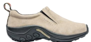
ジャングル モック

世界 160 カ国以上で愛され続けているアメリカ発祥のアウトドアブランド。1981 年に、カスタムメイドのカウボーイブーツの職人ランディ・メレルが職人としての腕を試すため、ハイキングブーツを作ったことから MERRELL の歴史は始まりました。MERRELL は創業から常にこれまでにない「新しさ」を追求し続け、ハイキングブーツやトレイルランニングシューズ、スポーツサンダルなど、アウトドアからライフスタイルまで、多彩なシューズを展開しています。世界中のバックパッカーから定評のある「モアブ」シリーズや、1998 年の登場以来、累計販売 1,700 万足を超える「ジャングルモック」シリーズ、アウトドアシーンからタウンユースまで幅広い用途で人気の「カメレオン」シリーズは MERRELL の代表作とも言えます。2021 年の MERRELL 誕生 40 周年アニバーサリーイヤーを経た次の 40 年もあらゆる人と自然を楽しみ、自然を大切にしていきたい。そんな思いを抱きながら、MERRELL は歩み続けます。