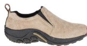
ジャングル モック

世界 160 カ国で愛され続けるアメリカ発祥のアウトドアブランド。1981 年に、カスタムメイドのカウボーイブーツの職人ランディ・メレルが職人としての腕を試すため、ハイキングブーツを作ったことから MERRELL の歴史は始まりました。MERRELL は創業から常にこれまでにない「新しさ」を追求し続け、ハイキングブーツやトレイルランニングシューズ、スポーツサンダルなど、アウトドアからライフスタイルまで、多彩なシューズを展開しています。世界中のバックパッカーから定評のある「モアブ」シリーズや、1998 年の登場以来、累計販売 1,700 万足を超える「ジャングルモック」シリーズ、アウトドアシーンからタウンユースまで幅広い用途で人気の「カメレオン」シリーズは MERRELL の代表作とも言えます。2021 年にブランド誕生から 40 周年を迎えた MERRELL は、次の 40 年もあらゆる人と自然を楽しみ、自然を大切にしていきたい。そんな思いを抱きながら歩み続けます。