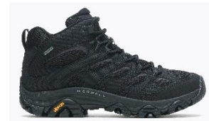
モアブ 3 シンセティック ミッド ゴアテックス