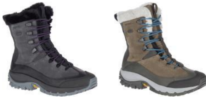
名称： THERMO RHEA MID WATERPROOF