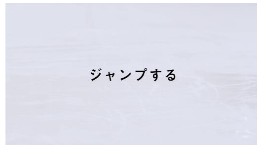
MERRELL YouTube チャンネルにて公開中「MERRELL-ARCTIC GRIP DEMONSTRATION-」