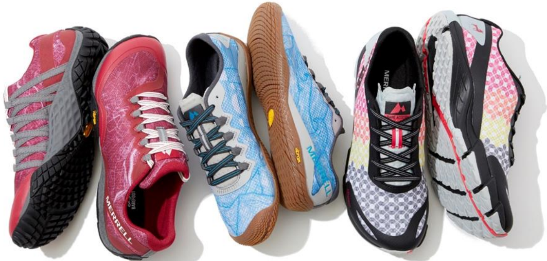
TRAIL GLOVE 4 SHIELD CPH 価格 14,000 円 (税抜)