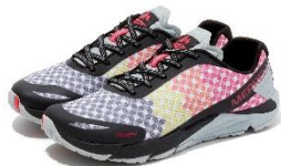
RED ROSE [ウィメンズ]