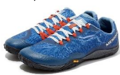
BLUE WING [メンズ]