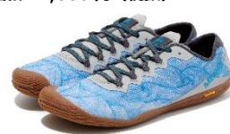
PALOMA [メンズ/ウィメンズ]