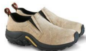
ジャングルモック

MERRELL HISTORY : http://www.merrell.jp/about/index.html