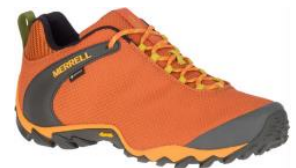
カメレオン 8 ストーム

MERRELL 公式オンラインストア : http://www.merrell.jp