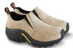
ジャングルモック

FW20コレクションでは『ONE SHOE. MANY ADVENTURES.～#どこだって冒険になる』を引き続きテーマに掲げ、キャンプからデイリーユースまで多様なアウトドアライフスタイルにマッチするシューズを提案します。