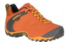
カメレオン 8 ストーム

MERRELL 公式オンラインストア : http://www.merrell.jp