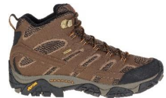
モアブ 2 ミッド ゴアテックス