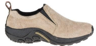
ジャングル モック

MERRELL YouTube チャンネル : https://www.youtube.com/channel/UC13E10yckCdRU8vCAhe1I-Q