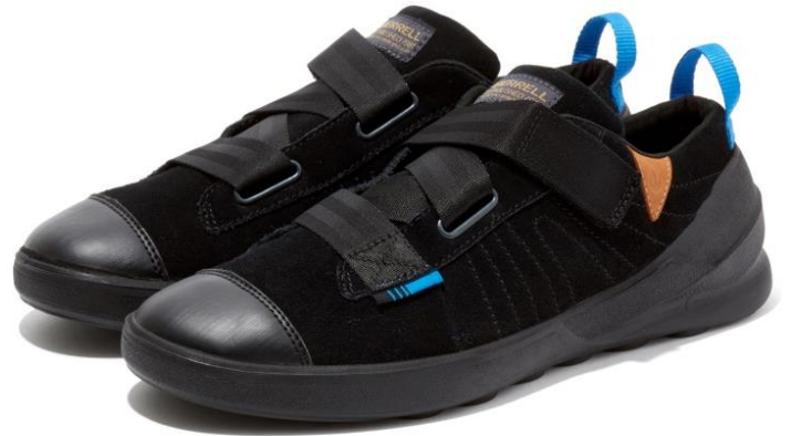
FLASH ASCENT SUEDE

世界 160 カ国で愛用される米国アウトドアブランド MERRELL（メレル、輸入総代理店：株式会社丸紅フットウェア）は、80 年代当時のクライミングシューズのエッセンスを用いて、現代風にアレンジしたライフスタイルシューズ「FLASH ASCENT MID SUEDE（フラッシュ アセント ミッド スエード） / FLASH ASCENT SUEDE（フラッシュ アセント スエード）」を 8 月上旬より発売します。