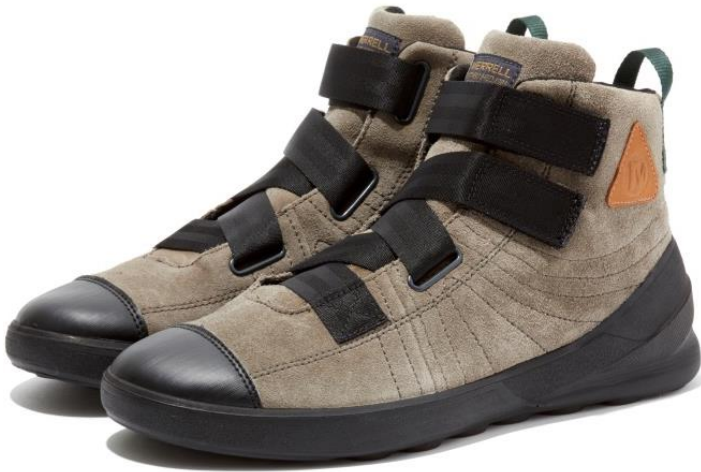
FLASH ASCENT MID SUEDE