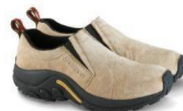
ジャングルモック

MERRELL HISTORY : http://www.merrell.jp/about/index.html