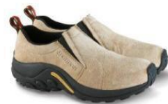
ジャングルモック

MERRELL HISTORY : http://www.merrell.jp/about/index.html