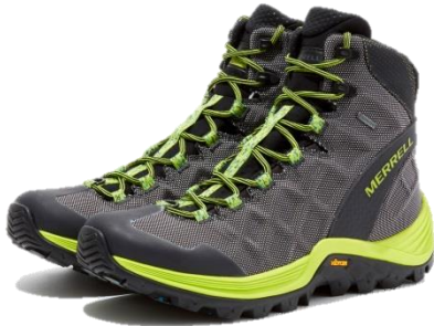
THERMO ROUGE MID GORE-TEX

「THERMO ROUGE MID GORE-TEX / THERMO CROSS MID WATERPROOF」10月より発売