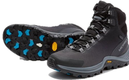
THERMO CROSS MID WATERPROOF

世界 160 カ国で愛用される米国アウトドアブランド MERRELL (メレル、輸入総代理店：株式会社丸紅フットウェア) は、凍った路面や雪の上でも滑らない圧倒的なグリップ性を誇るウィンターブーツ「THERMO ROUGE MID GORE-TEX (サーモ ローグ ミッド ゴアテックス) / THERMO CROSS MID WATERPROOF (サーモ クロス ミッド ウォータープルーフ)」を 10 月より発売します。