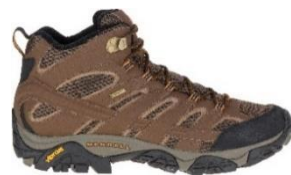
MOAB 2 MID GORE-TEX