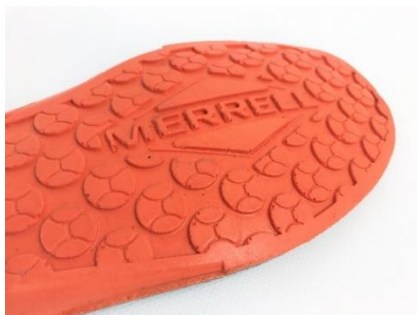
足形にフィットする EVA インソールベース