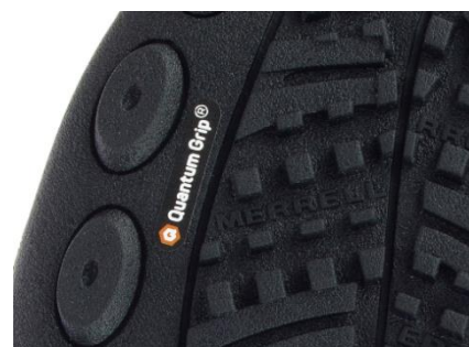
「クワンタムグリップ」コンパウンドアウトソール