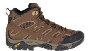
モアブ 2 ミッド ゴアテックス