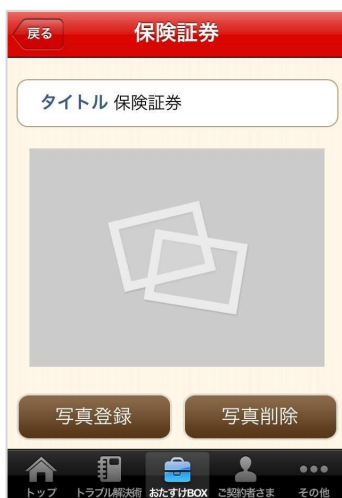
↑『おたすけBOX』の「いざフォト」の詳細ページ。「写真登録」ボタンから写真を登録することができます。