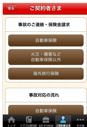
↑『損保ジャパンご契約者さま専用』の「事後のご連絡 請求金請求」ページ。加入保険に合わせた連絡方法や対応方法が見られます。

『損保ジャパンご契約者さま専用』は、「事故のご連絡 請求金請求」「ご契約者さま向けページ」の2項目に分かれており、損保ジャパンの自動車保険、火災・傷害保険、海外旅行保険などの連絡先や保険金の請求先を確認することができます。「事故のご連絡 請求金請求」では事故対応の流れを図で確認できるので、万が一の時にも慌てずにご対応頂けます。「ご契約者さま向けページ」からは損保ジャパン公式ホームページのご契約者さま向けページに遷移でき、各種手続きの方法などを照会することが可能です。