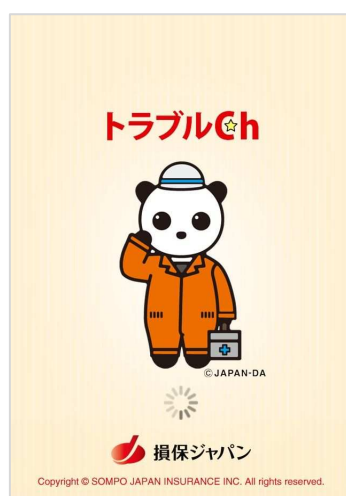
↑ローディング画面。

損保ジャパンはこれまでオフィシャルホームページ上で、事故発生時の保険金ご請求方法などの非常時に関する情報から、収納術などの生活に役立つ情報まで幅広くご提供して参りました。これらの情報をご提供していくうち、お客さまのご要望は保険に関連するものだけでなく、日常生活や旅行先での様々なトラブルの解決にあることが明らかとなってきました。このことを受け、損保ジャパンのご契約者さまに限らず、より多くの方々の身近なトラブル解決のお力になれるよう「トラブル Ch」が開発されました。