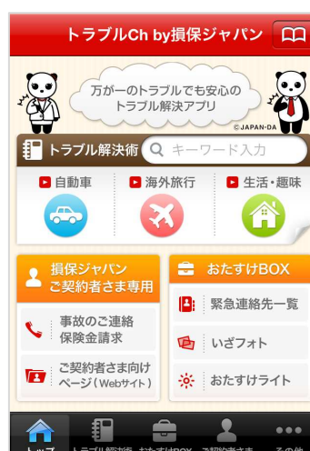
↑トップ画面。右上の本のアイコンをタップすると、ブックマークした『トラブル解決術』のQ&Aが見られます。