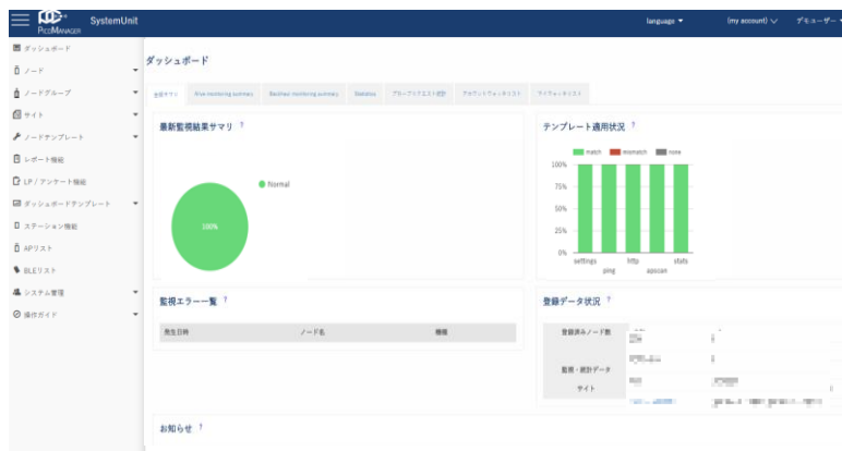
ダッシュボード画面イメージ