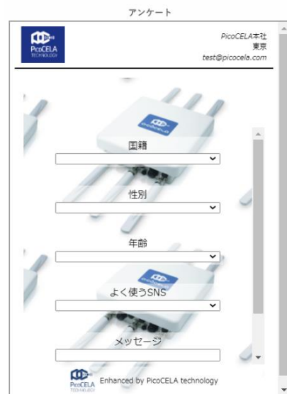
アンケート回答画面例

今後PicoCELAは、ピコセラ製品とクラウドシステム「PicoManager®」で、飲食店や小売店舗、公共施設などにおいて、安定した通信環境の提供に加え、販促やマーケティングに活用できる機能を余すことなくお使いいただけるよう、サポートに取り組んでまいります。