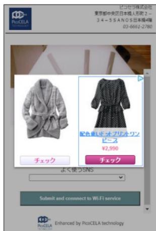
広告配信イメージ