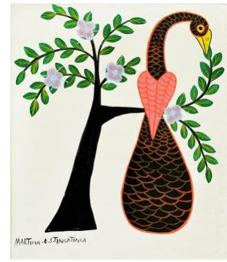
▲「花の樹にとまるクジャク～ホワイト」34,100円 (約56×44cm)