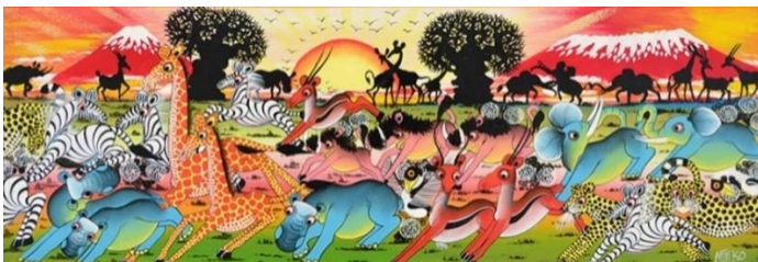
▲「大地を駆ける動物たち～夕焼けのキリマンジャロとバオバブ」51,700円 (約41×84cm)