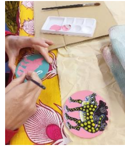
▲コースター作りイメージ