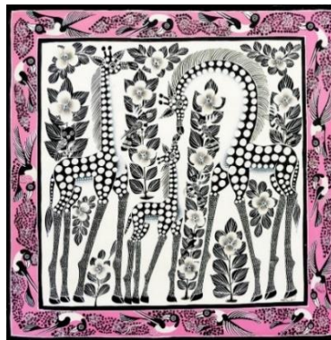
▲「しあわせを呼ぶキリンの家族～モノクロ～鳥の額縁(ピンク)」88,000円 (約78×78cm)