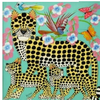
▲「チーターの家族」 16,500円 (約30×30cm)