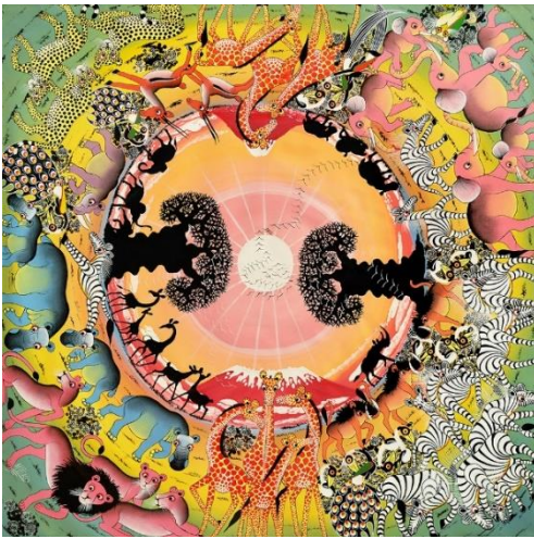
▲「地球へのオマーージュ～グリーン&ピンク」 165,000円 (約98×98cm)