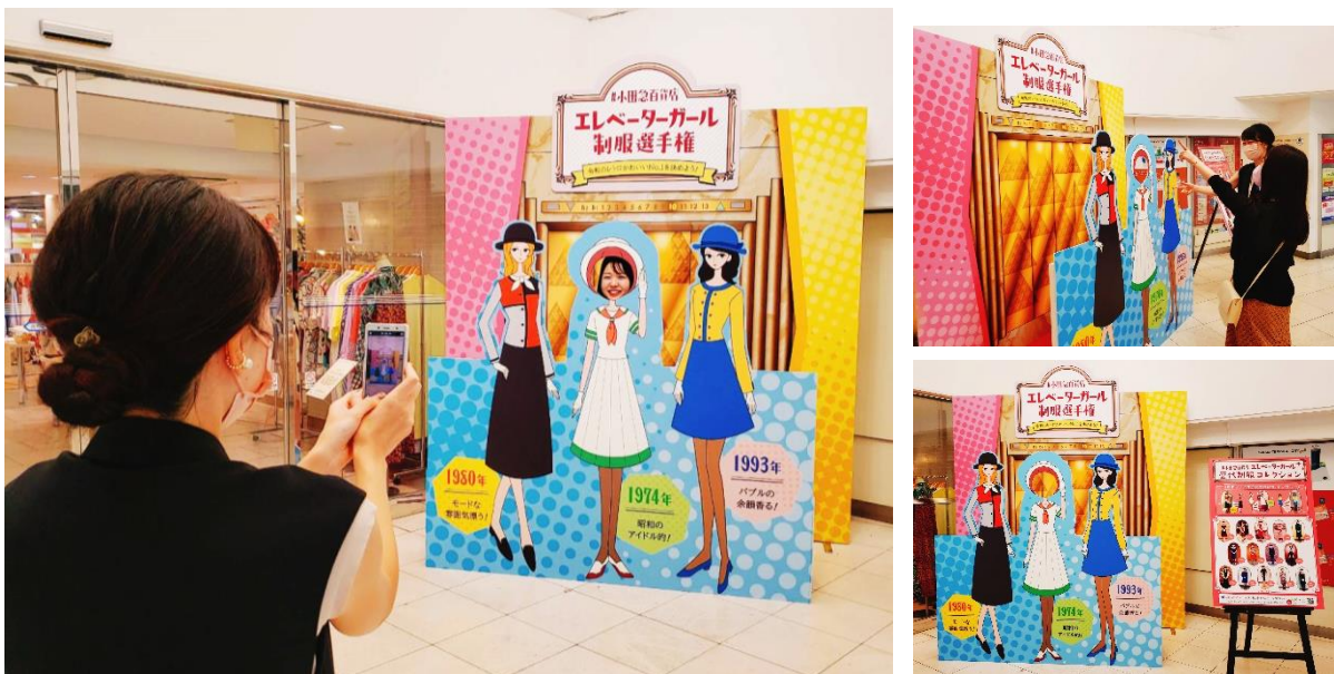
▲本館営業終了日まで設置！“エレガ”気分で撮影が楽しめるスポットが登場

公式ツイッターでは、新宿店のこれまでのエレベーターガールの制服の人気投票企画を実施するほか、店内入口にはエレベーターガールの「歴代制服コレクション」の紹介と「顔出しパネル」を設置。お子さまから大人の方まで、憧れの“エレガ”になりきって記念撮影ができる注目のスポットです。