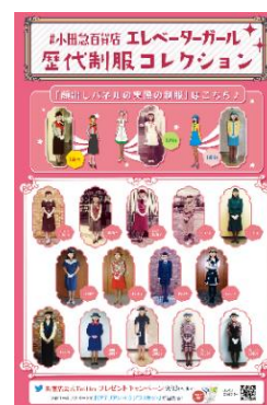
▲歴代制服コレクションポスター