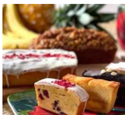
▲『アロハケーキ』パウンドケーキ

レジン（樹脂）を使用し、海や自然をモチーフにしてハワイの美しい魅力を伝える人気アーティスト、サラ カードル。作品のなかではハワイの海の色や波の動、砂の色などがキラキラとした宝石のように輝きを増すことから、“宝石を描くアーティスト”と賞賛されています。会場では、2021年に惜しまれつつもアーティスト活動を休止したサラ カードルのレジンアート（版画）を展示販売するほか、ベギー ホッパーやマーガレット ライスなどハワイを描くアーティストの作品も展開します。