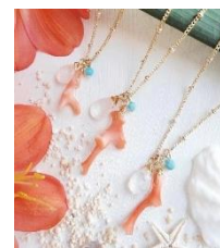
▲『アトリエシー』アクセサリ

そのほか、リリコイやマカダミアチョコなど上質な材料でしっとり食感に仕上げた『アロハケーキ』のパウンドケーキや『ハナリマ』『アトリエシー』が出店し、ハワイアン雑貨やアクセサリを販売します。