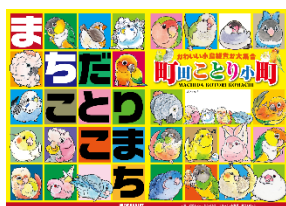
▲オリジナルノート

期間中、1レシート3,000円(税込)以上お買い上げの各日先着100名様に「オリジナルノート」をプレゼント。また、期間中お買い上げの各日先着300名様に催事限定オリジナルの「ステッカー」をプレゼントします。