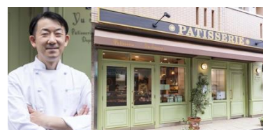
▲『パティスリー ユウ ササゲ』