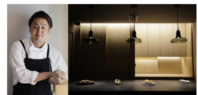
▲ 『DOLCE TACUBO』