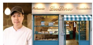
▲ 『Pâtisserie Leslines』