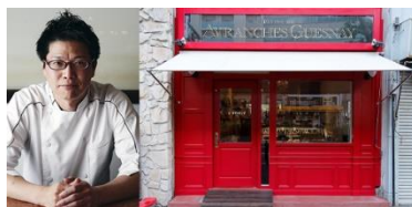
▲ 『AVRANCHES GUESNAY』