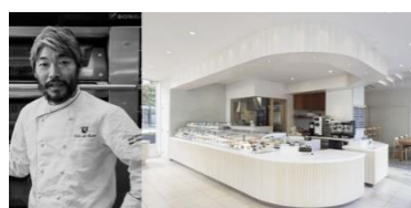
▲ 『Éclat des Jours』