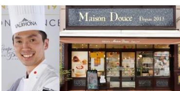
▲ 『Pâtisserie Maison Douce』