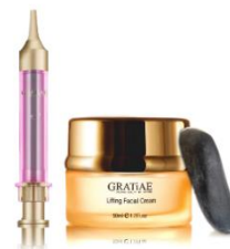
▲『グラティエ』（イメージ）