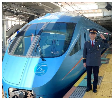
▲小田急線町田駅で駅長体験（イメージ）

小田急線町田駅で、お子さまが制服を着用して電車の出発指示合図体験や記念撮影のほか、普段は入ることのできない駅施設の見学をしていただけます。さらに、ロマンスカーミュージアムでは、実写映像を見ながらリアルな操縦体験が楽しめる運転シミュレーターにて運転士体験も。体験終了後にはロマンスカーミュージアム内のレストランにてご家族でランチをお楽しみいただけます。