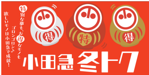
▲「小田急 冬トク」を初開催

小田急百貨店では、2024年1月2日（火）から全店で開催する「小田急 冬トク」企画の一環として、12月20日（水）からお得に特別な体験が楽しめる「2024年小田急スペシャル夢袋」の応募抽選の受付を各店店頭にてスタートします。今年で23回目を数え毎年人気のお子さまが駅長体験をできる恒例企画のほか、今年は新たに箱根の旅を満喫できるプランや美容体験、デパ地下スイーツ企画が登場します。