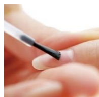
▲ネイルケア（イメージ）