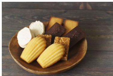
▲デパ地下スイーツ（イメージ）

小田急百貨店町田店のデパ地下ショップから 3,000 円相当のスイーツを毎月お届けします。1 月は新規オープンの『ラ・マーレ・ド・チャヤ』から、2 月は『麻布かりんと』からお届けします。3 月以降は届いてからの楽しみ。さらに「スイーツクーポン（10,000 円分）」付きです。