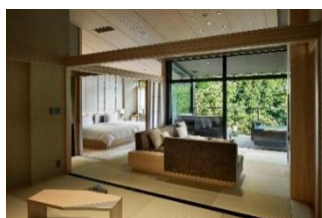
▲『はつはな』客室（イメージ）