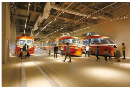
▲ロマンスカーミュージアム（イメージ）