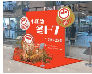
▲1階正面入口の装飾イメージ