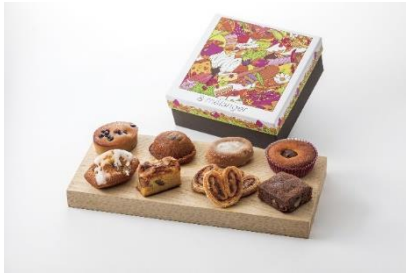
▲コラボ BOX A「Marron」