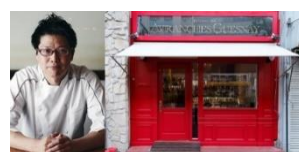
▲ 『AVRANCHES GUESNAY』