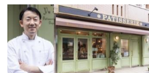
▲『パティスリー ユウ ササゲ』