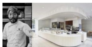
▲『Éclat des Jours』