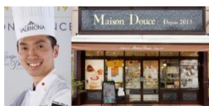
▲『Pâtisserie Maison Douce』