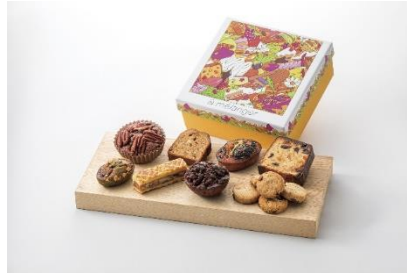
▲コラボ BOX B「Méli-Méro」