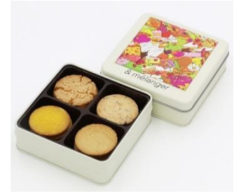
▲コラボクッキー缶「Niigata」