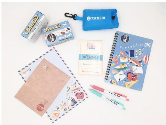
▲「文具女子博」でしか手に入らないオリジナルグッズも販売

“インクとデコ沼”をテーマに、老舗から注目のメーカーまで30社以上が出店し、万年筆・インク・ガラスペンに加え、SNSでも話題の「手帳デコ」が楽しめるマスキングテープ、スタンプ、シールなど幅広いアイテムを展開します。会場で見ても触れて、そして文具メーカーの方と交流しながらお気に入りの一品を見つけてください。