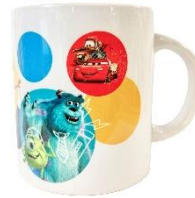
イベント限定商品 ▲マグカップ 1,870円