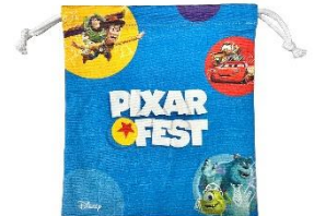
イベント限定商品 ▲巾着 660円 ※4月16日(土)発売