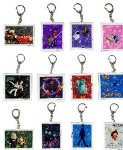
イベント限定商品 ▲ランダムアクリルキーホルダーコレクション (全12種) 各550円