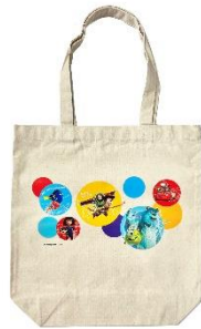
イベント限定商品 ▲トートバッグ 2,420円