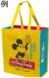
▲サステナブルバッグ 500円