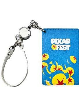
イベント限定商品 ▲ICカードケース 2,310円