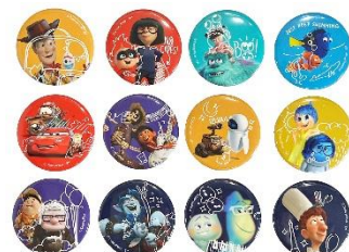
イベント限定商品 ▲ランダム缶バッジコレクション (全12種) 各440円