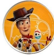
▲アクリルコースター