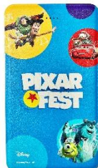
イベント限定商品 ▲モバイルバッテリー 5,060円