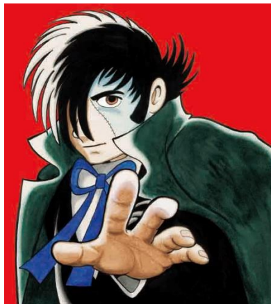
▲「神の手」41×37 cm 165,000 円