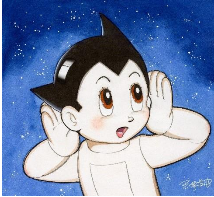
▲新作版画「耳のチカラ」37×40 cm 110,000 円