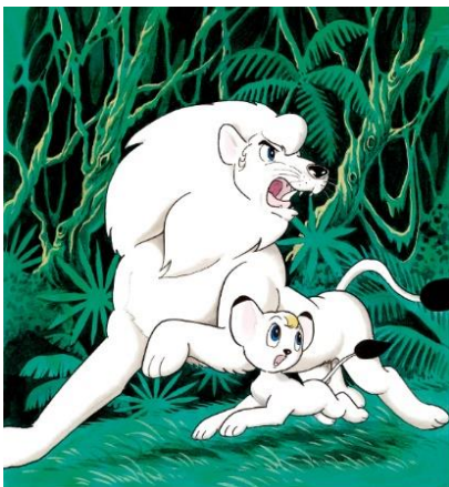
▲「バンジャとレオ」41×38 cm 165,000 円