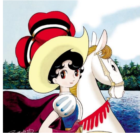
▲「リボンの騎士」45×44 cm 165,000 円