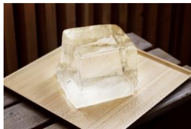
▲「三ツ星氷室」の天然氷を使用

かき氷の店『埜庵』は2003年に日本初の通年営業のかき氷専門店として開業。日光屈指の氷室「三ツ星氷室」の純度の高い天然氷をやさしく削ることで生まれるふわふわの食感に注目です。また、季節に合わせて作る手づくりのシロップが絶品と話題で、日本各地から熱烈なリピーターが来店しています。会場では定番メニューのほか、週替わりで限定メニューも登場します。