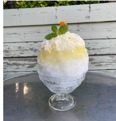
▲かき氷の店『埜庵』（イメージ）