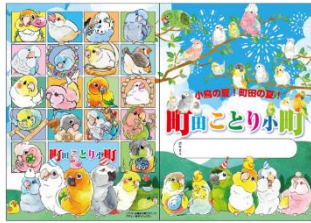
▲オリジナルノート（A5サイズ）

期間中、1レシート3,000円（税込）以上お買い上げの各日先着100名様に「オリジナルノート（A5サイズ）」をプレゼント。また、期間中お買い上げの各日先着300名様にイベント限定の「ステッカー」をプレゼントします。