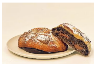
▲ 『OZ とハルコの旅するベーカリー』