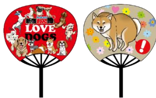
▲オリジナルうちわ

期間中、1 レシート 3,000 円 (税込) 以上お買い上げの各日先着 100 名様に「オリジナルうちわ (1点)」を、また、期間中、お買い上げの各日先着 300 名様に新宿わん博限定オリジナル「ステッカー (1点)」をプレゼントします。