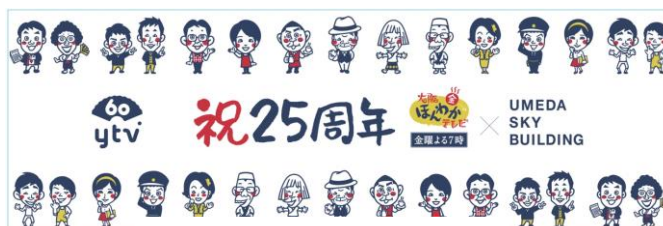
W25 周年コラボ限定手ぬぐいプレゼント