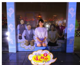
ほんわかメンバーなりきりフォトスポット

「梅田スカイビル」と「大阪ほんわかテレビ」を 25 年間支えていただいた、みなさまに感謝を込めて。暑さを忘れて、素敵なひと時をお楽しみください。