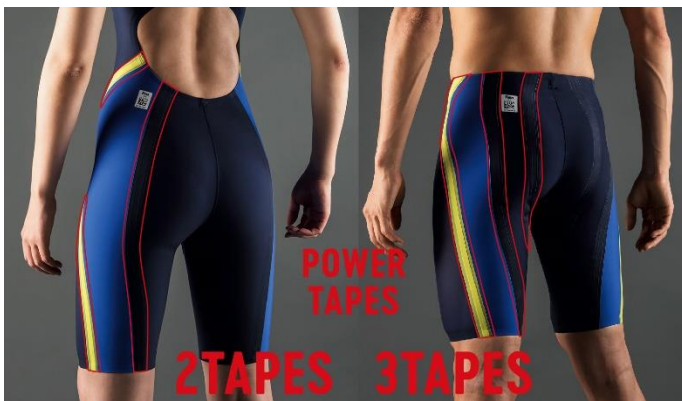
女性用には2本、男性用には 3本のパワーテープを配置