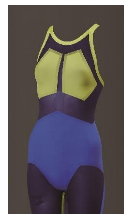
全面ではなく、パーツで配置した 裏地で着圧を軽減