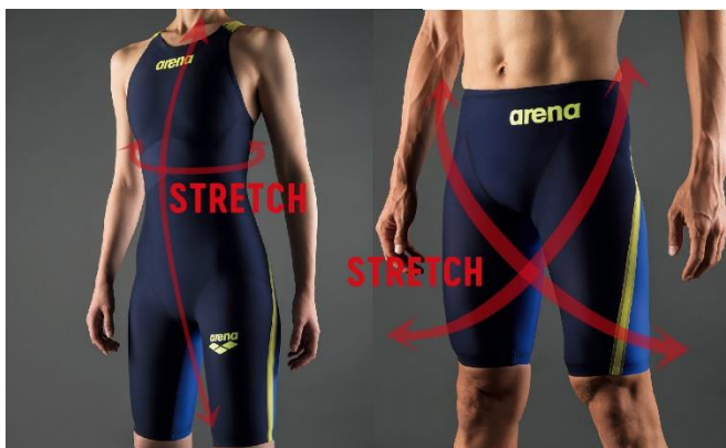
前身頃を1パーツで構成