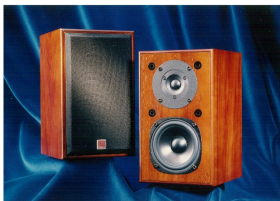
2世代目モデル ROYAL MENUET 1994年～2009年生産 ※この間、ROYAL MENEUTからROYAL MENUET IIへとモデル・チェンジしました。