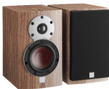
4世代目モデル DALI MENUET 2015年～生産