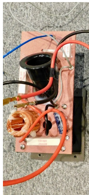
レギュラーモデル

さらに、入力部となるスピーカーターミナルについては、レギュラーモデルではRUBICONグレードのターミナルを採用していましたが、SEではより堅牢で大型となるEPICONグレードのターミナルを採用しています。より確実に、あらゆるスピーカークーブルの端末をホールドします。