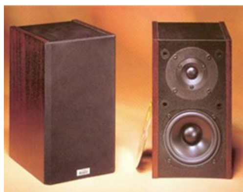
初代モデル DALI150 MENUET 1992年～1994年生産