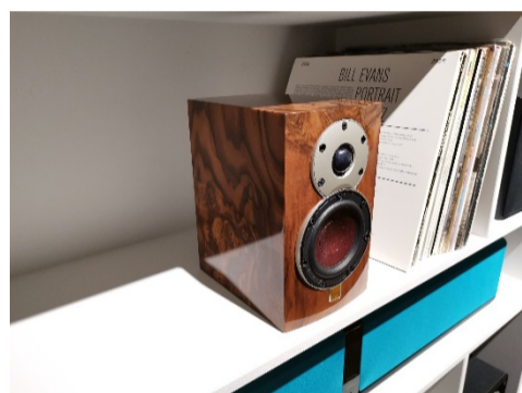
DALI MENUET SE スペシャル・エディション 2020年発売