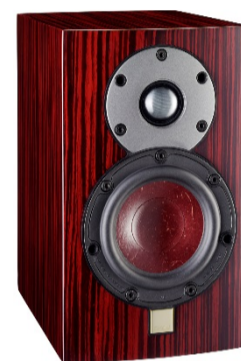
MENTOR MENUET SE 2013年～2015年生産 DALIの創業30周年記念モデルとして2年間の み生産された限定バージョン