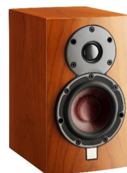
3世代目モデル MENTOR MENUET 2009年～2015年生産