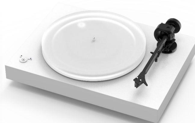
X2/WH (マット・ホワイト)