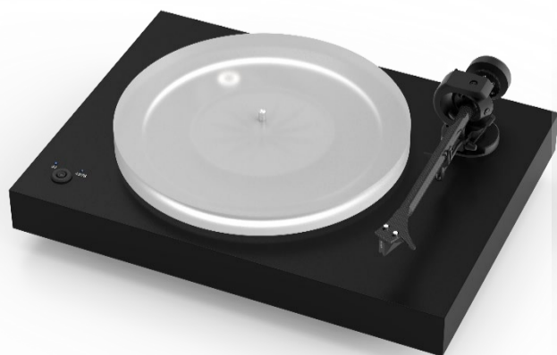
X2/BK (マット・ブラック)