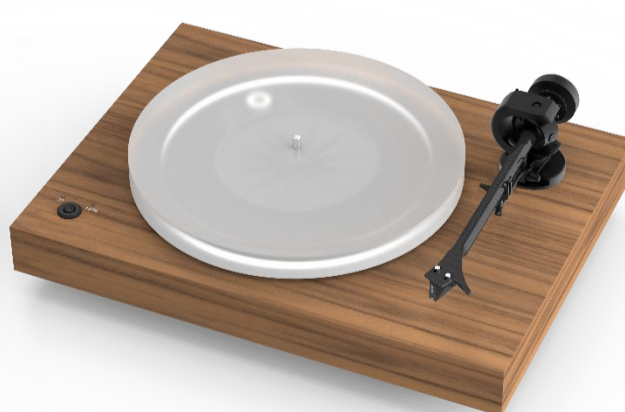
X2/MW (マット・ウォルナット)