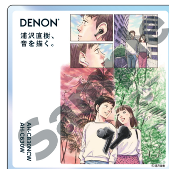
9cm×9cm アクリル製 コースター