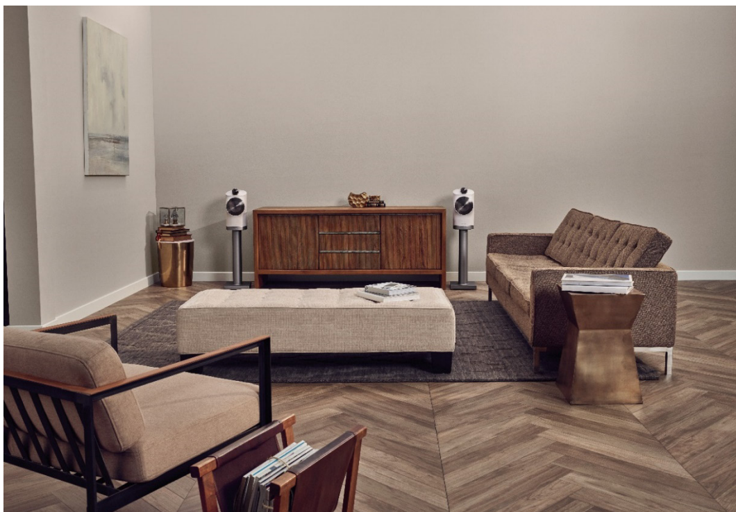
「800シリーズ」直系の技術を採用したスタンドマウント型のワイヤレススピーカー Formation Duo 希望小売価格：495,000円（2台1組・税込） ※スピーカースタンドは別売です