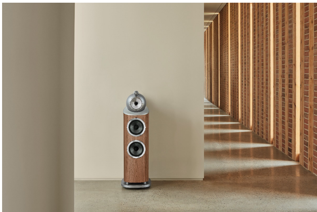
Bowers & Wilkinsのフラッグシップ「800 Series Diamond」のフロアスタンディングスピーカー 803 D4 ウォールナット 希望小売価格：1,881,000円（1台・税込）