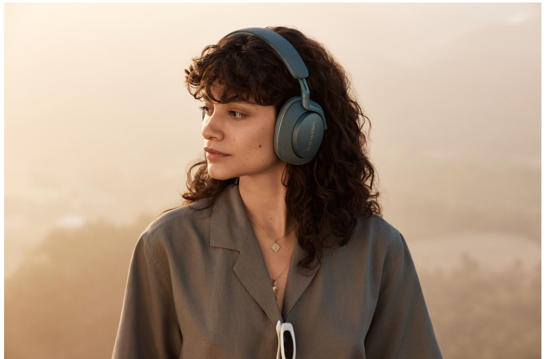
Bowers & WilkinsのTrue Soundを外出先でも堪能できるオーバーイヤー・ノイズキャンセリングヘッドフォン。ファブリックを用いた上質な仕上げと4色のカラーバリエーションが特徴。 Px7 S2e オープン価格