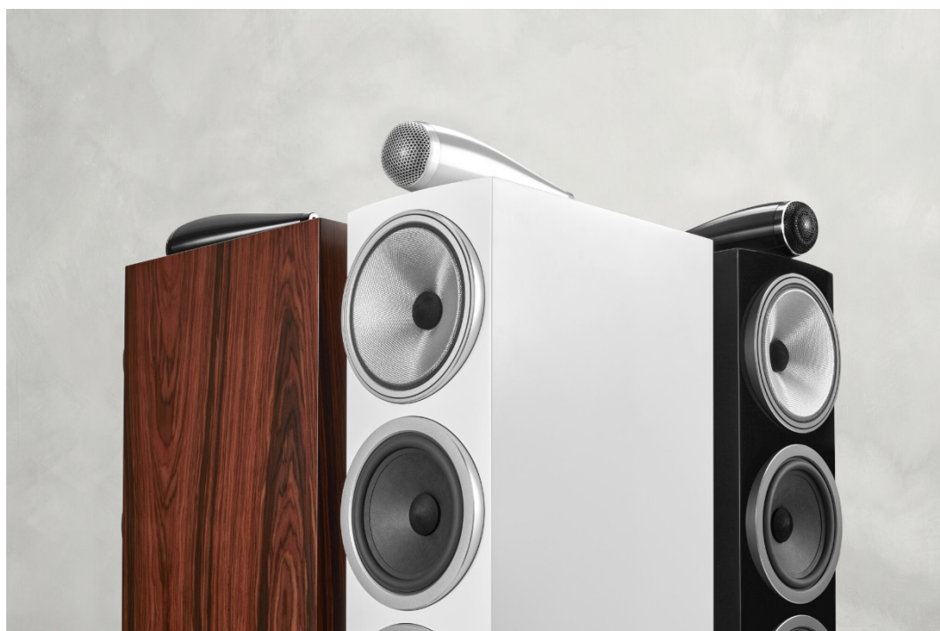
Bowers & Wilkinsのホームオーディオ用スピーカーのセカンドグレード「700 Series」のフロアスタンディングスピーカー 703 S3 グロス・ブラック 希望小売価格：495,000円（1台・税込）