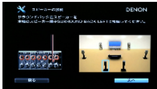
セットアップ画面(スピーカー接続)