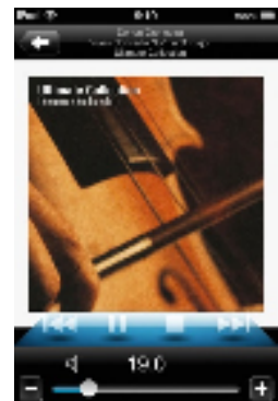
iPhone に表示したメイン画面