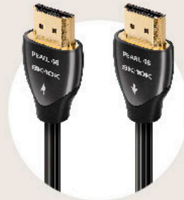
48Gbps 対応 HDMI ケーブル Pearl 48 / 3.0m (PEA48G/3M)