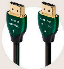
48Gbps 対応 HDMI ケーブル Forest 48 / 1.0m (FOR48G/1M)