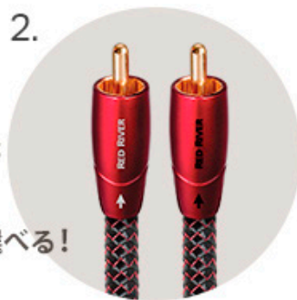
オーディオケーブル (RCA) Red River 1.5m ペア