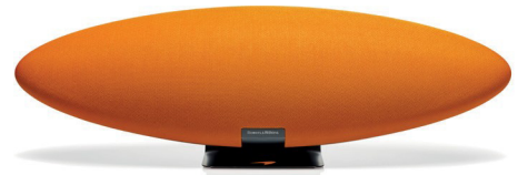
Zeppelin McLaren 60th Anniversary Edition