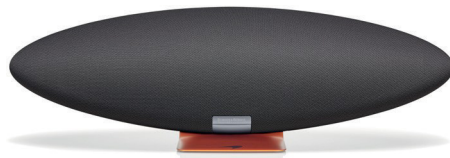
Zeppelin McLaren Edition