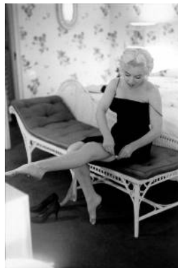
Marilyn Adjusts Her Stockings NEW YORK - MARCH 24: Actress Marilyn Monroe gets ready to go see the play 'Cat On A Hot Tin Roof' in her hotel room on March 24, 1955 at the Ambassador Hotel in New York City, New York.