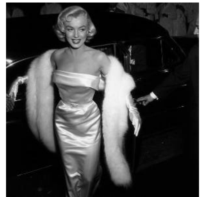
Monroe At Premiere: 1954: Marilyn Monroe (1926 - 1962) arriving at the premiere of the film 'There's No Business like Show Business'. IMAGE