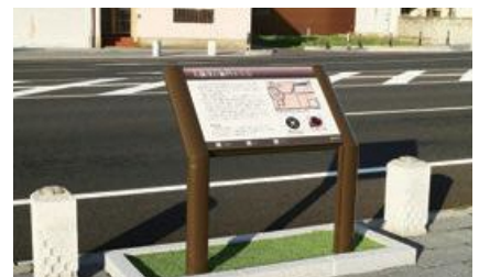
大手前通りサイン