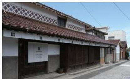
NIPPONIA 出雲鷺浦 漁師町