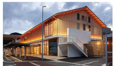
隠岐ユネスコ世界ジオパーク 中核・拠点施設(隠岐ジオゲートウェイ)