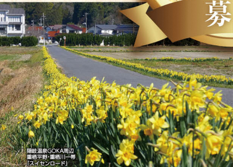
隠岐温泉GOKA周辺 重栖平野・重栖川一帯 「スイセンロード」