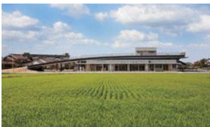
浜山あまつひ保育園