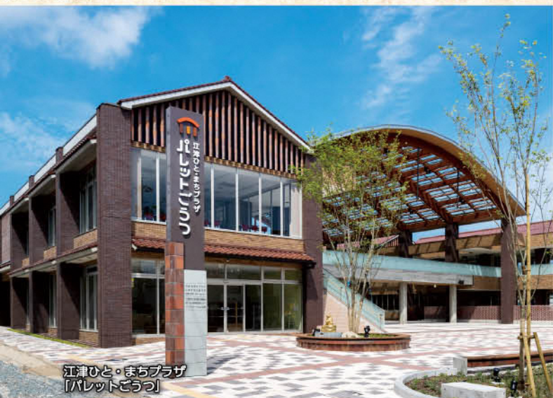
江津ひと・まちプラザ 「パレットどうつ」