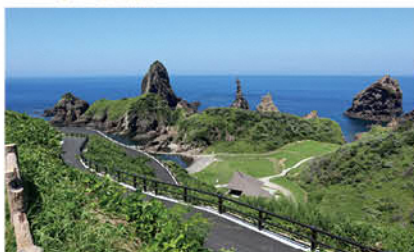
大山隠岐国立公園 国賀浜園地園路