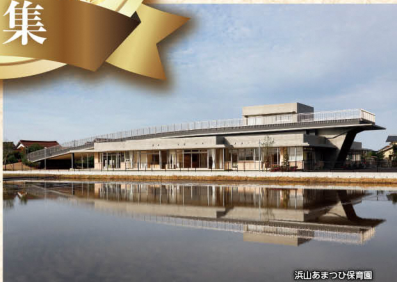
浜山あまつひ保育園