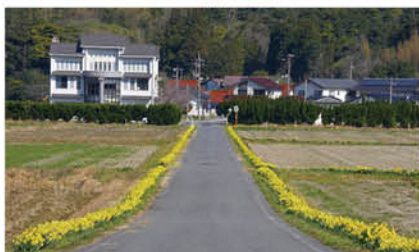
隠岐温泉GOKA周辺 重栖平野・重栖川一帯「スイセンロード」