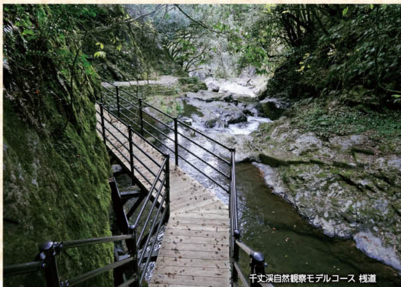
千丈溪自然観察モデルコース 栈道