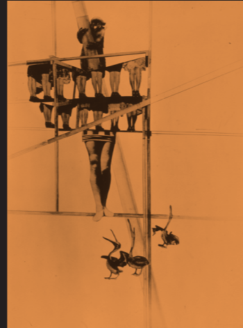
■ラーズロ・モホイ=ナジ 《世界の構造》1925年

1925年重要な著作「絵画・写真・映画」が、バウハウス叢書の一冊として出版された。1930年に「ニュー・ヴィジョン」も刊行。ナチの圧力により、1928年グロピウスが辞任すると同時に彼もバウハウスを去り、アムステルダム、ロンドン、パリでデザイナー、写真家、映画作家として生計を立てるが、1937年シカゴに移住。後にアメリカ写真教育に多大な影響を及ぼすことになるニュー・バウハウスの教授となる。1946年シカゴに没す。