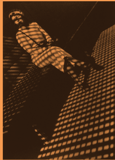
■アレクサンドル・ミハイロヴィッチ・ロトチェンコ 《ライカを持つ少女》1934年