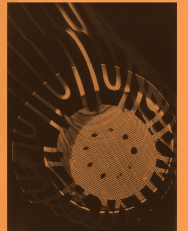
■ラースロ・モホイ=ナジ 《フォトグラム》1923年

1920年代から30年代にかけて、写真表現の可能性は飛躍的に高まり、まさに写真の黄金期を迎えた。ドイツではモホイ=ナジが、カメラを介さず、直接印画紙に露光するフォトグラムを発見し、理論面においても「絵画・写真・映画」を著して、バウハウスを拠点に新たな写真表現の先鞭をつけた。フランスでも同時期、マン・レイがレイヨグラフィ、ソラリゼーション、多重露光など、実験精神に富む魅力的な作品群を生み出した。さらにロシアでは、ロトチェンコがロシア構成主義の手法を写真表現に応用し、雑誌やポスター等の印刷媒体を駆使した写真の方向性を示している。展示室4では、ドイツ、フランス、ロシアにおいて展開したモダン・フォトグラフィの豊かな表現を、ナジ、マン・レイ、ロトチェンコを中心に約130点展観する。