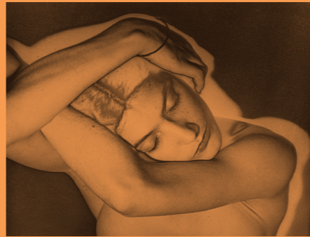
■マン・レイ 《眠るモデル》1929年頃