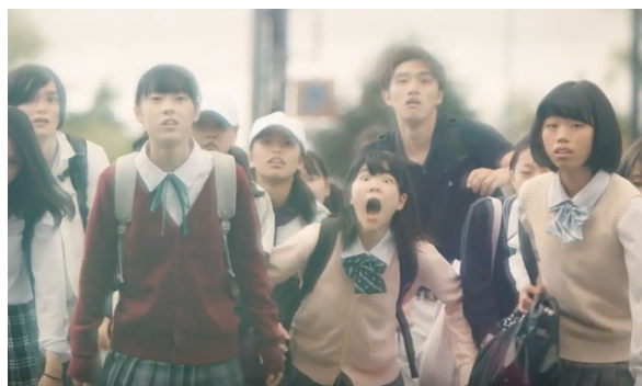
▼地元の高校に通う演劇部のみなさんの名演技にもご注目♪

「美肌の湯」として名高いこの温泉街に、広さ日本最大級の 混浴大露天風呂である“長楽園”を貸し切り入浴シーンを 撮影しました。『タピ肌』になりながら撮影♡と、 キャストの皆さんもテンションが上がりましたがさすがに メイクを重ねるとのぼせてしまった模様でした。（笑）