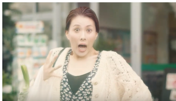
▼選び抜かれた島根出身の美肌の持ち主。その驚きの先に何が！？